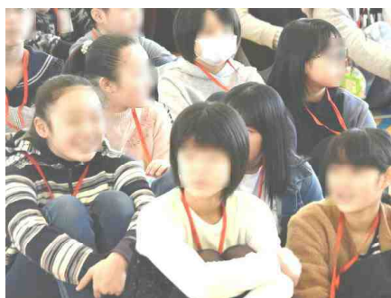
【上の写真の左から5年生・5年生・6年生，下の写真の左から2年生・1年生・6年生】