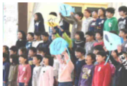
【6年生を送る会での各学年の出し物の様子＝左から2年生・3年生・4年生：2/28（水）】