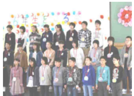
【「6年生を送る会」の様子からパート2=左から3年生・くす玉成功・6年生の歌:2/28】