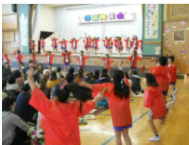
【△年生による「よさこい踊り」】