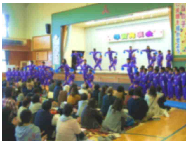
【△年生の組み体操の場面：10/28撮影】

11月も終わりを迎えました。今年のカレンダーも残すところあと1枚になりました。最近では、雷の発生が頻発すると同時に、『ハタハタの季節』がやって来ました。本格的な冬の到来が間近です。