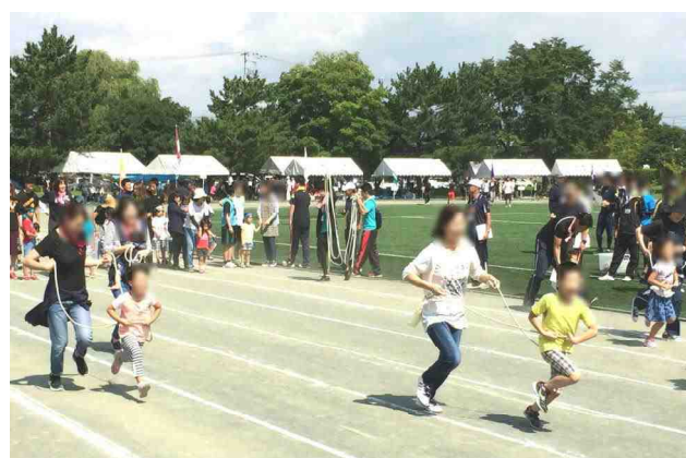
【運動会で力いっぱい走る風の子たち：9/3】【「親子でシュッポップ」低学年の親子です】

9月に入りました。季節はすっかり秋の気配です。校舎の3階から見渡す湖岸地域は黄金色に彩られ、たわわに実った稲の重みによって日に日に頭を垂れ始めてきています。一年の中で田園風景が最も美しい季節を迎え、風の子たちは、ふるさとのよさを実感しながら毎日元気に登校しています。