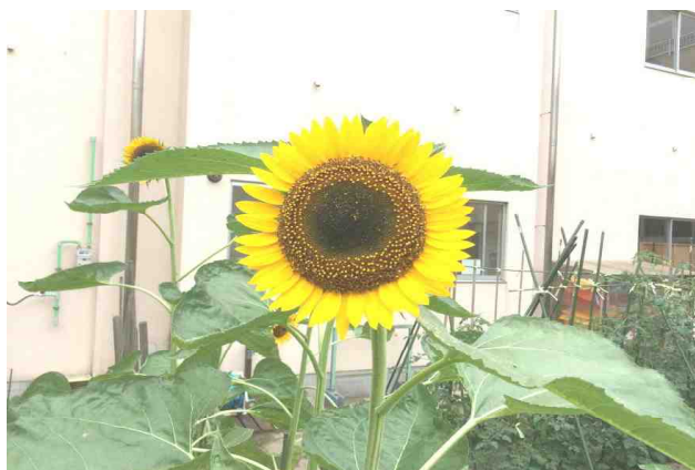
【校内の畑に咲いたひまわりの花 : 8/4】

昨日は暦の上では処暑。秋田ではまもなく夏の終わりを迎えようとしています。さて、7月22日からの秋田県内における集中豪雨により、被災された皆様及びご親族の皆様にご見舞い申し上げます。被害に遭われた皆様の健康・安全と、一日も早い災害復旧を心からお祈り申し上げます。