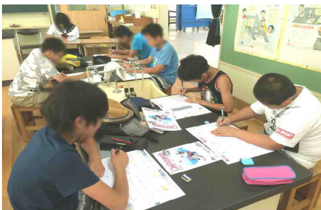
【夏休み学習会の様子(6年生) : 7/24】