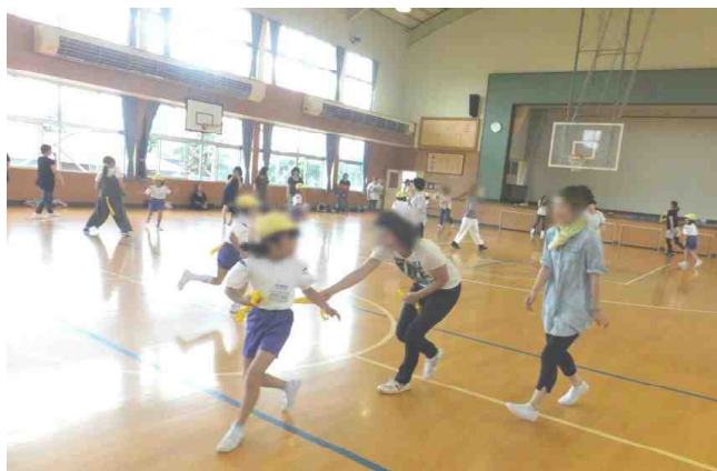
【2年生の親子レクの様子から：7/13】