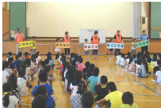
【1～3年・防犯教室から：7/20】