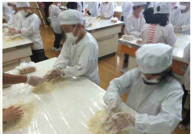
【左は「味噌づくり」の仕組みを学びました。右は「大豆と塩と麴」を混ぜ合わせる4年生：6/1】