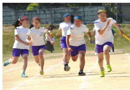
【左から：4年生の徒競争，係活動を頑張る5年生，白熱した色別選手リレー⇒6年生】

5月20日(土)に行われました運動会は、お天気に恵まれ、全校の風の子たちの「力いっぱい・心を合わせた頑張り」のおかげで、素晴らしい運動会となりました。また、応援にお出でいただきました、たくさんの保護者並びにご家族の皆様、熱いご声援等ありがとうございました。ご来賓の皆様をはじめ、ご家族の皆様のご協力により、運動会の進行等もスムーズに進めることができました。晴天とともに気持ちのよい運動会となりました。