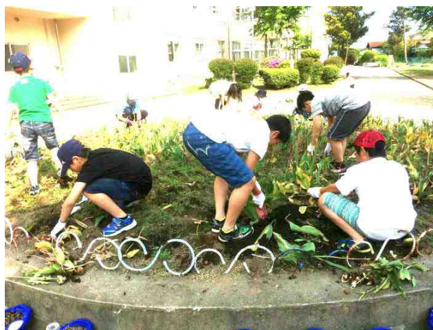
【チューリップの球根を大事に集めて選別する環境整備委員会の5年生と6年生：5/29】