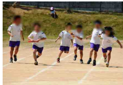
【左の写真から：1年生の徒競走，2年生の学年レク種目から，3年生の全員リレーから】