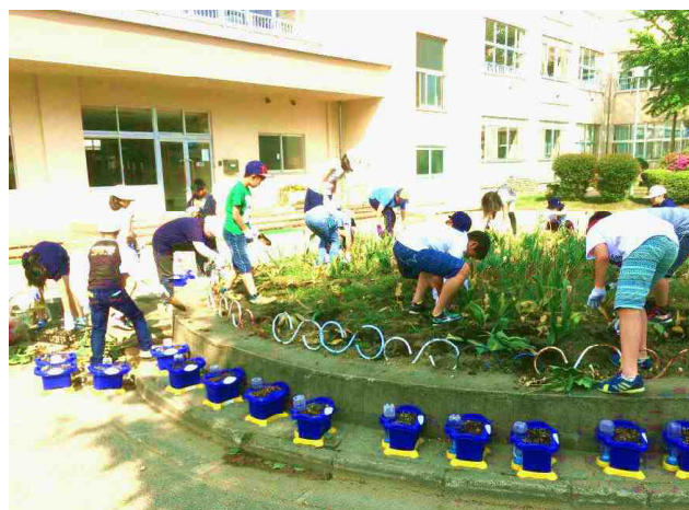
【チューリップが咲き終えた円形花壇をきれいにする環境整備委員会の5・6年生：5/29】