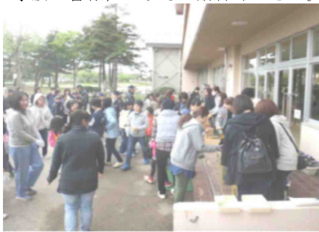
【PTA早朝親子奉仕作業での様子から：5/14】