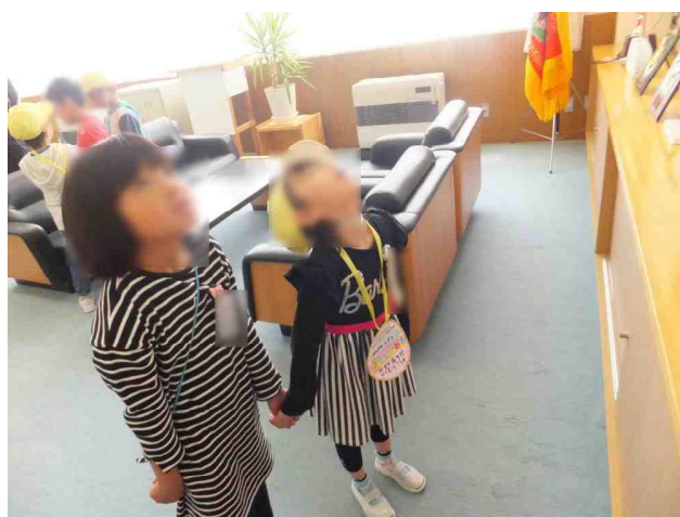
【〇・〇年生の「なかよし学校探検」の様子から:5/12】

さて、新年度がスタートして約1ヶ月半。風の子たちは、新学年での学校生活にもすっかり慣れ、毎日、元気に学習や児童会活動などに励んでいます。