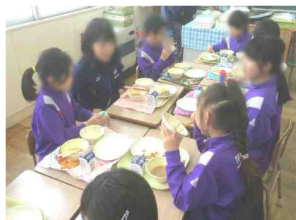
【左から△年生での読み聞かせ、ALTの先生と一緒に外国語活動、△年生と給食：2/2撮影】