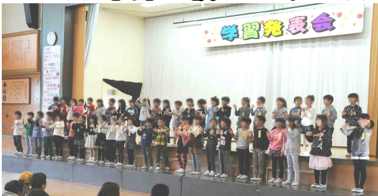
【学習発表会における△年生による『天小探検隊 出発!』での一場面：10/29撮影】

雪の便りが届く季節になりました。皆様のご家庭では、冬支度はもうお済みでしょうか。天気予報によると、明日は秋田県の平野部でも雪の予報が出ています。そんな中、風の子たちは今朝も元気いっぱい校庭やグラウンドで駆け回っています。子どもたちには寒さに負けず、風邪など引かないよう『手洗いやうがい』をしっかりと心がけさせたいと思います。ご家庭でも、ご家族の皆様からの声かけをよろしくお願ひします。