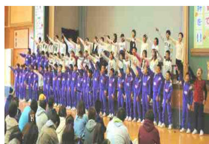
【学習発表会での各学年の発表：左から△年生・△年生・△年生の一場面：10/29撮影】

そこで、△△中・天王小・△△小の3校では、連携して11/15(火)～17(木)の3日間を『アウトメディアデー』に取り組むことにしました。これは、分かりやすく言うと、 電子ゲームなどの利用から離れる時間を主体的に設けるとともに、家族との会話やコミュニケーションを一層深めることがねらいです。