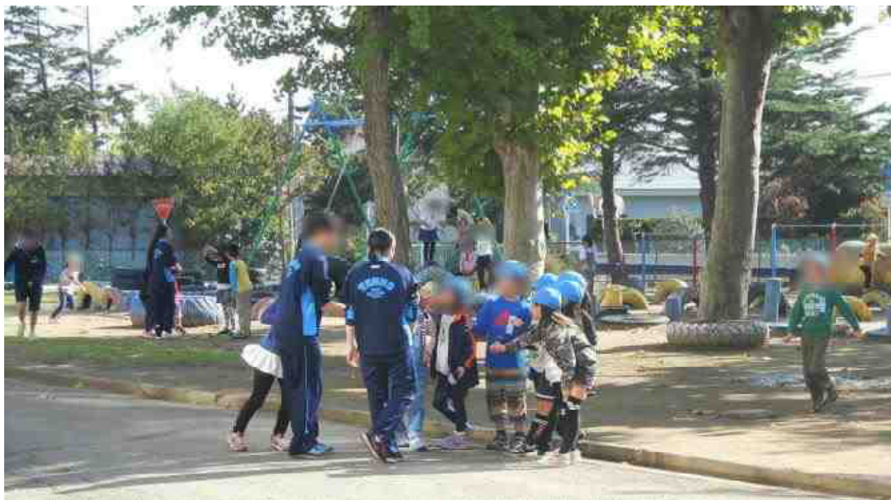
【昼休みの時間に校庭で子どもたちと一緒に遊ぶ中学生たち：10/18撮影】

10/18(火)～21(金)にかけて、「潟上市キャリア・スタート・ウィーク」(CSW)が行われ、本校にも5名の中学生が「職場体験」にやってきました。5名とも本校の「風の子」のOBとOGです。