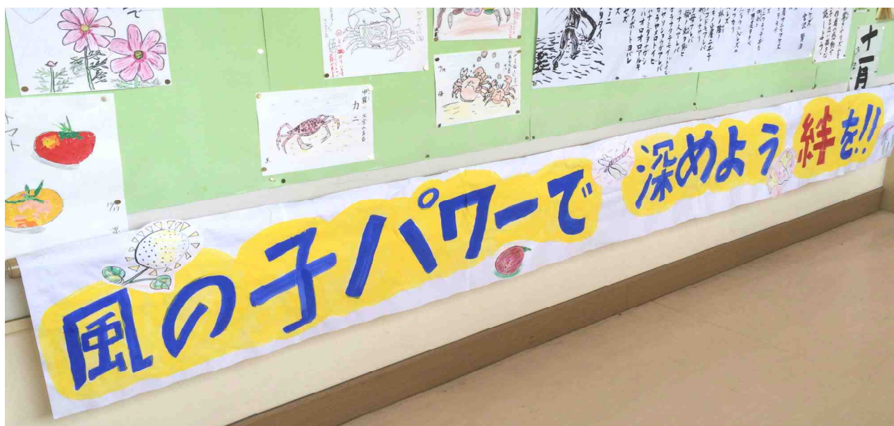
【〇〇組の廊下掲示板に貼られた手づくりの『学習発表会のテーマ』です：10/21撮影】

校内から子どもたちの歌声が聞こえてきます。昼休みの時間も CD の音楽に合わせて踊りのパート練習に励むグループがいます。朝の校内放送では、全校合唱で歌う2つの曲が流れています。こうした中、天王小ではいよいよ明後日(10/29)、学習発表会を迎えます。子どもたちの伝えたい思いや願いが、ご家族や地域の皆様の心根に届くことを願っています。