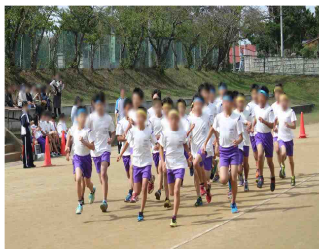
【風の子マラソン＝5年女子の力走：9/30】【全力で駆け抜ける風の子たち＝6年男子】

明日は暦の上では寒露です。10月に入り朝晩はかなり寒くなってきました。天王地区でもおおかた稲刈り作業が終了したようです。さて、今日で平成28年度の前期が無事終了しました。これまで半年間、保護者並びに子どもを守る会、地域の皆様には多大なご支援とご協力をたまわり、本当にありがとうございました。おかげで、全校の子どもたちが大きなケガや病気で休むことなく、408名全員が元気に前期の終業式を迎えることができました。