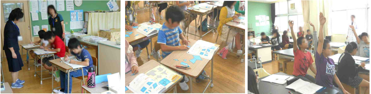
【左から：つばき組での国語授業の様子 図形を並べる2年生 理科で発表する5年生】

当日は、訪問された先生たちから、以下のような貴重なご意見をいただきました。風の子の頑張りを率直に認めていただき、大変うれしく思いました。