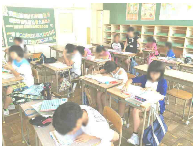
【天中生を招いて夏休み学習会：4年生】【夏休み学習会で課題に取り組む5年生：7/26】

暦の上では「処暑」を迎え、夏の暑さがようやく峠を越え朝晩はだいぶ涼しくなってきました。