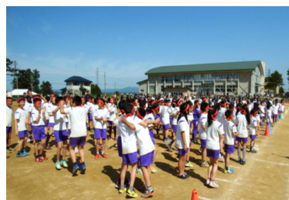
【左から：黄組の応援風景，色別対抗リレーでのバトンパス，優勝の発表に歓喜する紅組】

五月晴れのもと，5月14日(土)に行われました大運動会は，大きなケガ人もなく，成功裡に終わることができました。また，子どもたちにとっては，さわやかな海の風が涼風となり，熱中症にかかることもなく過ごしやすい気温での運動会となりました。今年の運動会は，子どもたち等の意見を取り入れて，5年ぶりに「赤組」を復活させ，3つの色組による対抗戦で行いました。午前部の部が終了した時点で3つの組とも接戦を演じるなど，白熱した展開となりました。閉会式では，赤組が小差での優勝を果たし，赤組の子どもたちの歓喜の声がグラウンドに響き渡りました。