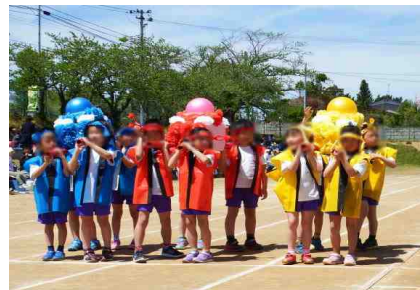
【左から：1年生の玉入れ，2年生の「デカッきれいになあれ」，3年生のおみこしリレー】