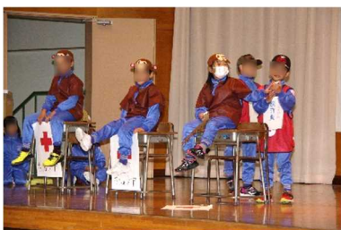
2年「どうぶつ園のじゅうい」