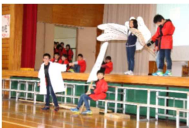
3年「チャレンジ ～新しい世界へ～」