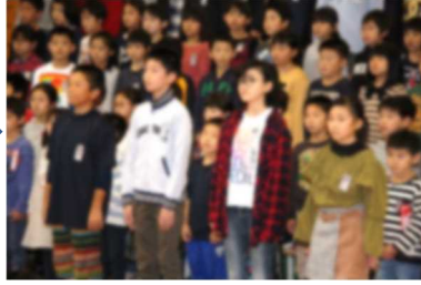
最後は、6年生の気持ちのこもった「おわりのあいさつ」