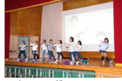
ダンスクラブ「Memory of Sakura Momoko」