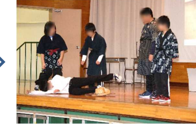
6年「宮沢賢治の夢見た世界」