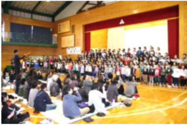
全校合唱「ふるさと」※コール飯田川の皆様も特別参加しました。「Tomorrow」