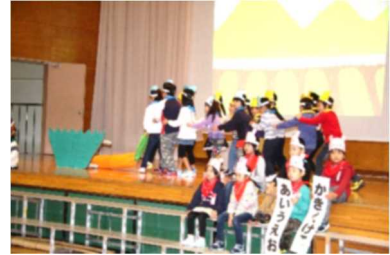
1年「どうぶつむらのあいうえおマーチ」