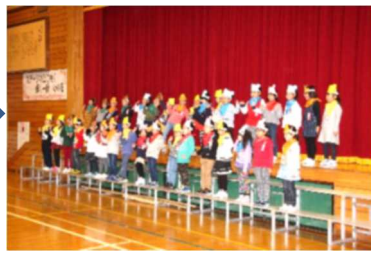
1年生、元気な「はじめのあいさつ」