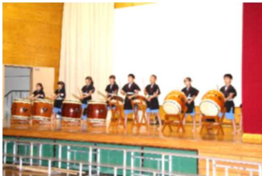
オープニングは、和太鼓クラブ「寄せ太鼓」

10月27日(土)、平成30年度学習発表会が飯田川小体育館で、盛大に行われました。6年〇〇〇〇さんが考えた「ステージの上に咲く輝く一輪 心の花」のテーマの下、児童一人一人は、日頃の学習で身に付けたものを見事に大勢の観客の前で、元気いっぱいに披露しました。保護者や地域の方々からは、「とても素晴らしい学習発表会だった。」「子どもたちのがんばりが見え、健やかに成長しているなど感じた。」などお褒めの言葉をいただきました。