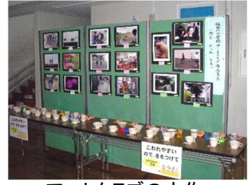
アートクラブの力作「陶芸&写真」