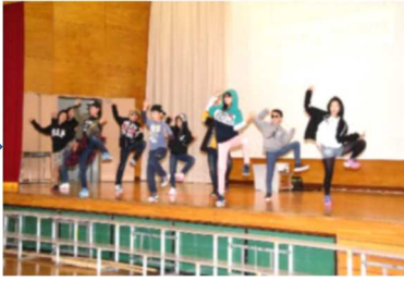
5年「5年生だよ 全員集合！」